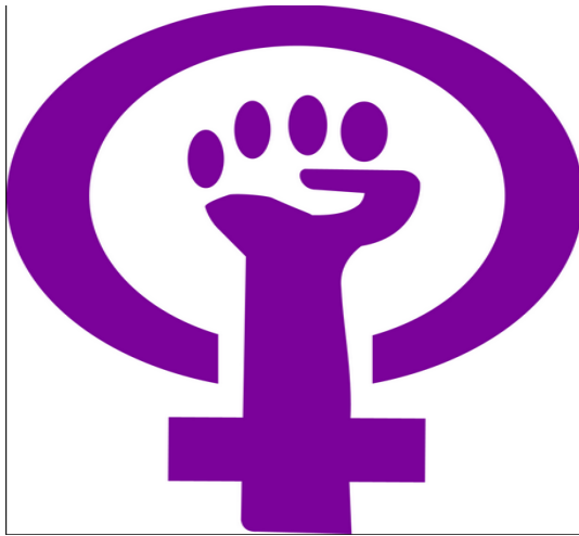
شکل شماره ۱: علامت چهار انگشت خوابیده بر روی انگشت شست نماد اعمال خشونت خانگی علیه زنان است.

کشورهای مختلف با توجه به امکانات و ظرفیت‌های خود باید در کاهش تنش و خشونت در درون خانواده به ویژه علیه زنان و کودکان فعال باشند. برخی از کشورها راه‌حل‌های جالب توجهی برای گزارش و کاهش خشونت خانگی علیه زنان اتخاذ کرده‌اند. برای نمونه در کشورهای آمریکای جنوبی و برخی از کشورهای اروپایی از زنان درخواست