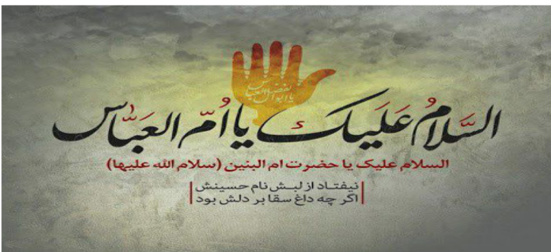
نیفتاد از لیش نام حسینش اگر چه داغ سقا بر دلش بود